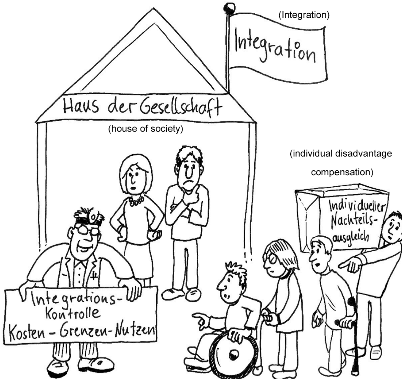
(Integration- Control: Costs , Limits, Benefit)