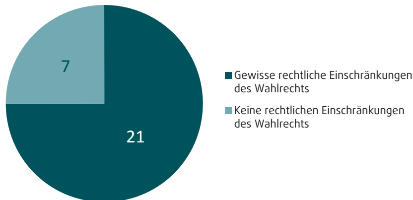
Abbildung 1: Können Menschen, denen die Rechts- und Handlungsfähigkeit entzogen wurde, an Wahlen teilnehmen, nach EU-Mitgliedstaat?