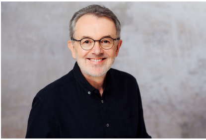
Foto: Bernd Strohschein, Vorstandsvorsitzender der Deutschen Tinnitus-Liga e. V. (DTL).